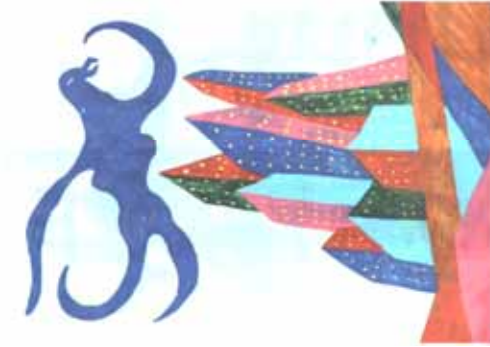
foglio a destra