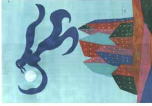
foglio a sinistra